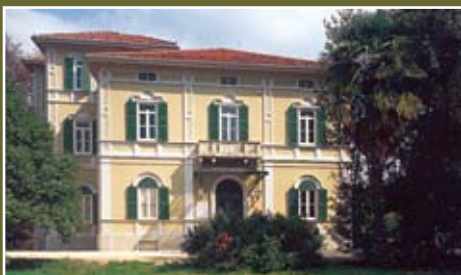
Villa Carinzia - Viale Martelli 51 PORDENONE