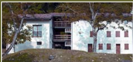
Accademia Faunistica c/o Parco S.Floriano - POLCENIGO (PN)